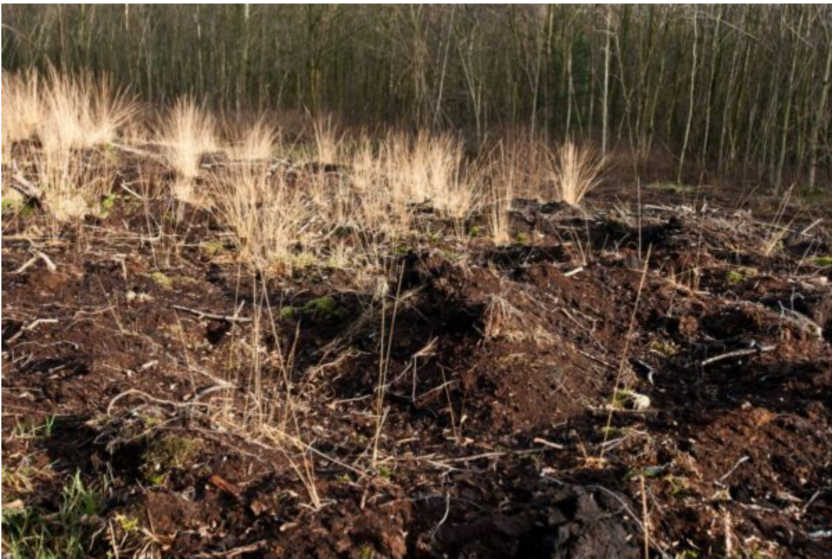
Hoogveen in het Oosterbos

Vlak in de buurt van Nieuw-Dordrecht kun je een prachtige wandeling van ongeveer zes kilometer maken door het Oosterbos. Het bos oogt als een ongerept natuurgebied, maar de schijn bedriegt... Wat nu het Oosterbos is, lag een eeuw geleden nog een kaal veenmoeras. Maatschappij Klazienaveen begon aanvankelijk enthousiast met de vervening, maar de onderneming werd één grote mislukking. Ontdek zelf de verraderlijke schoonheid van het Oosterbos tijdens deze bijzondere wandeling door een voormalig veengebied!