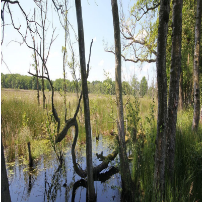
Appelbergen bij Glimmen