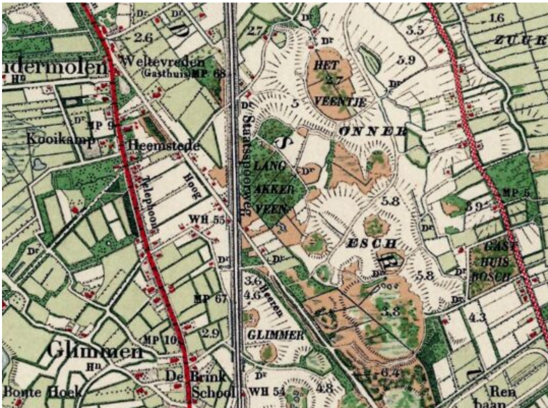
Het gevarieerde landschap van de Appelbergen op de topografische kaart uit 1925