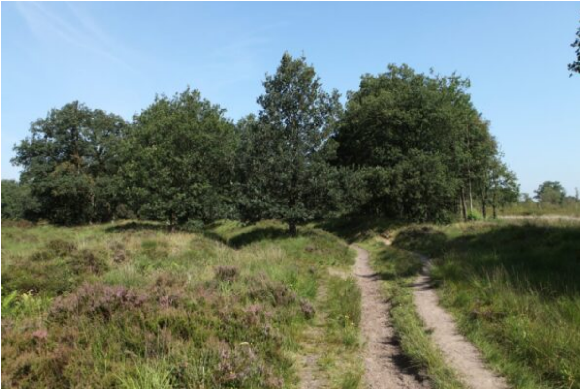
Karrensproren bij de Appelbergen