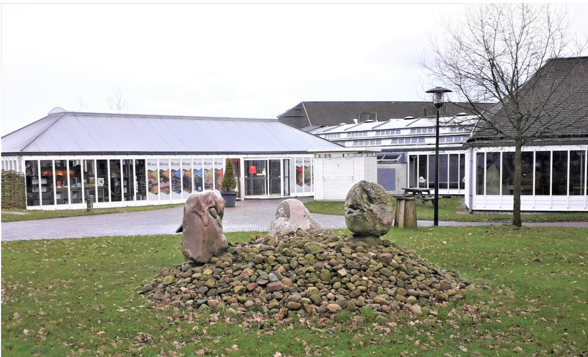
Beginpunt bij het Hunebedcentrum in Borger

Het Drentse Landschap heeft in samenwerking met het Hunebedcentrum een nieuwe fietstocht ontwikkeld. De route is 25 kilometer lang en komt langs maar liefst elf hunebedden in de omgeving van Borger, Bronneger en Gasselte. Deze nieuwe fietsroute is voor het hele gezin en onderdeel van de bewustwordingscampagne rond de hunebedden. Je kunt de route afhalen bij het Hunebedcentrum, het kantoor van Het Drentse Landschap (Kloosterstraat 5 te Assen) en via een aantal TIP's. Of downloaden op de website van het Drentse Landschap. Daarnaast zijn op deze website leuke opdrachten als aanvulling op de fietsroute te vinden. Benieuwd naar deze opdrachten, kijk dan op de website van het Drentse landschap .