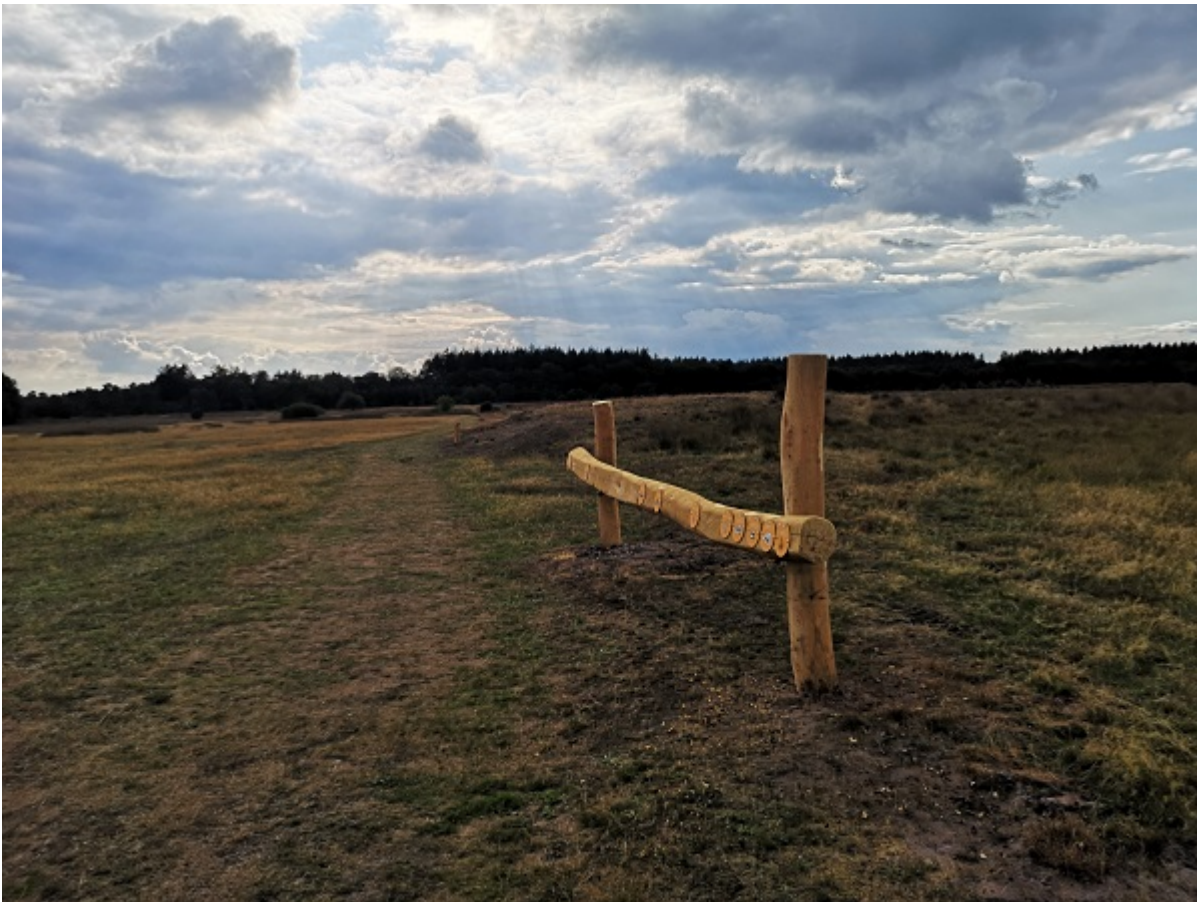
Die Zeitleiste in der Heide

Diese 7,5 km lange Weg führt durch Wälder, Heide und Sandflächen, vorbei an Großsteingräbern und den Äckern zwischen Exloo und Odoorn. Hier gibt es erstaunliche Überreste aus den Eiszeiten, zum Beispiel Findlinge und den rätselhaften Wallberg, das ist eine eiszeitliche Sandformation, die sich durch die Landschaft schlängelt.